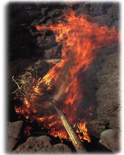
A. Aguilar, 1999

A mediados del siglo XX, un grupo de lanzaroteños apuesta por abrir la isla al turismo partiendo de los propios recursos, verdaderamente simples pero convertidos con grandes dosis de imaginación en rasgos exclusivos de una Isla abierta a los visitantes.